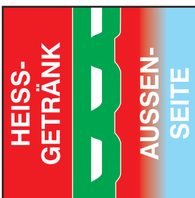
2-wandig mit Aussenwelle

Well-Cup- 1-wandig ist der Klassiker. Der Karton-Trinkbecher, wie man ihn kennt- aber aus extra starkem Karton, damit der Gast das Heißgetränk auch ohne Balance-Akt genießen kann. Ein richtig frischer Kaffee sollte jedoch auch seine Temperatur haben- der 1-wandige Becher isoliert aber nur für begrenzte Zeit. Selbstverständlich ist der Karton und seine hauchdünne, innenliegende Kunststoffschicht umweltfreundlich und lebensmittelrechtlich unbedenklich über die geltende Gesetzgebung hinaus.